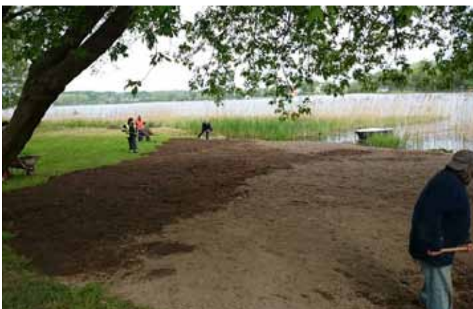
Wyrównywanie terenu nad jeziorem