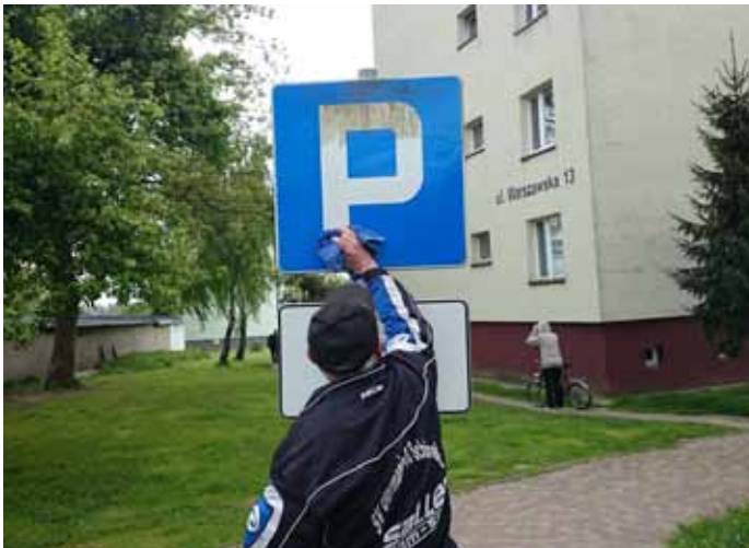
Konserwacja oznakowania drogowego