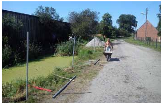
Grodzenie stawku w Sąpolnicy