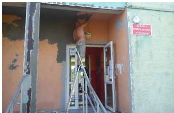
Remont w Szkole Podstawowej w Strzelewie.