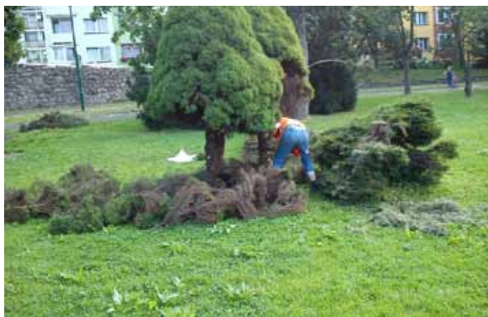
Pielęgnacja terenu nad jeziorem