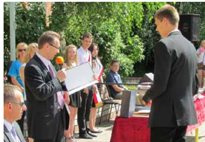
Publiczne Gimnazjum nr 2 w Zespole Szkół Ogólnokształcących w Nowogardzie