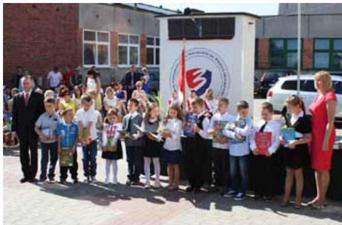
Szkoła Podstawowa nr 3 im. Polskich Olimpijczyków w Nowogardzie