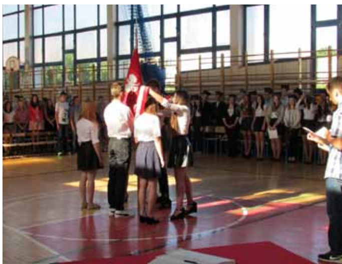
Publiczne Gimnazjum nr 3 im. Zjednoczonej Europy w Nowogardzie