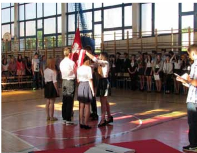
Publiczne Gimnazjum nr 3 im. Zjednoczonej Europy w Nowogardzie