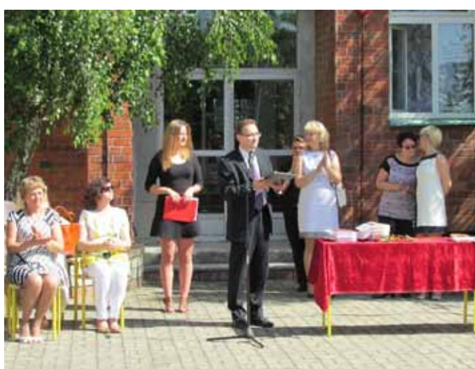
II Liceum Ogólnokształcące w Zespole Szkół Ogólnokształcących w Nowogardzie