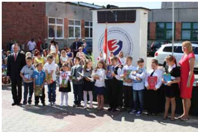
Szkoła Podstawowa nr 3 im. Polskich Olimpijczyków w Nowogardzie