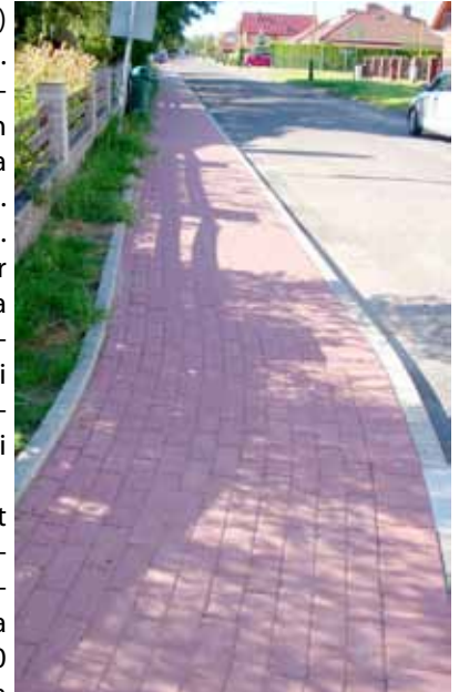
Tak wygląda po remoncie