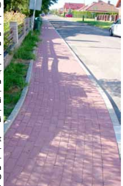
Tak wygląda po remoncie