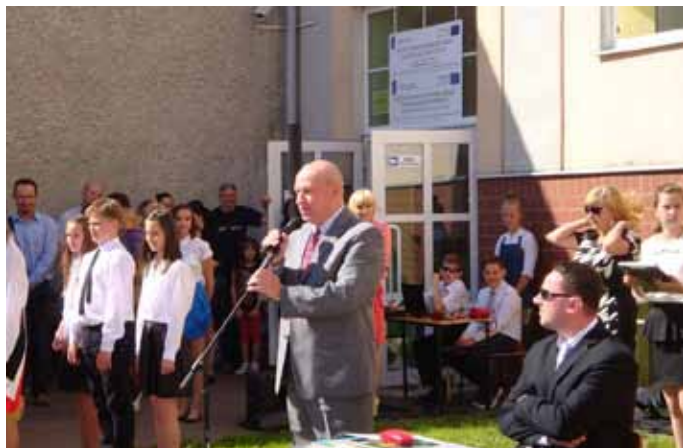
Szkoła Podstawowa nr 1 im. Tadeusza Kościuszki w Nowogardzie

ciechy otrzymywały nagrody, a najlepsi stypendia ufundowane przez burmistrza Nowogardu (patrz obok) . Na koniec, uczniowie udali się do swoich klas, gdzie podziękowali nauczycielom i odebrali świadectwa, a po odebraniu świadectw zaczęło się... odliczanie - Ileż to dni wakacji przed nami?