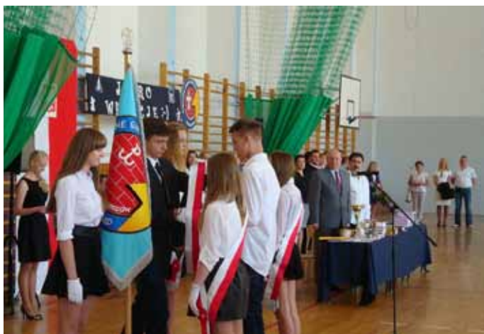
Publiczne Gimnazjum nr 1 im. Szarych Szeregów w Nowogardzie