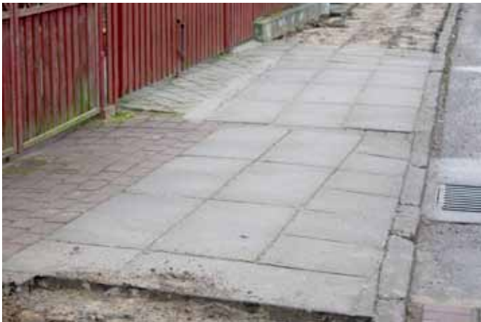
Tak wyglądało przed remontem