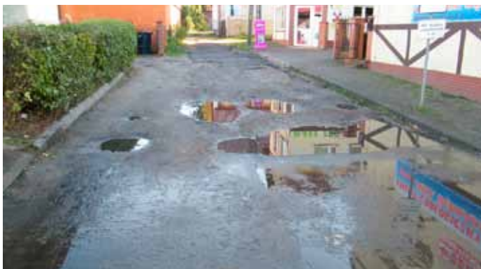
Tak było przed remontem

Zakres prac obejmował: wzmocnienie podbudowy drogi, ułożenie nowej nawierzchni jezdni z kostki betonowej typu POLBRUK Eko na dotychczasowej drodze brukowej, która była w bardzo złym stanie technicznym. Ułożenie nowej nawierzchni z kostki betonowej typu POLBRUK na chodniku.