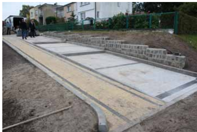
Remont nawierzchni schodów na ul. Kilińskiego w Nowogardzie po remoncie