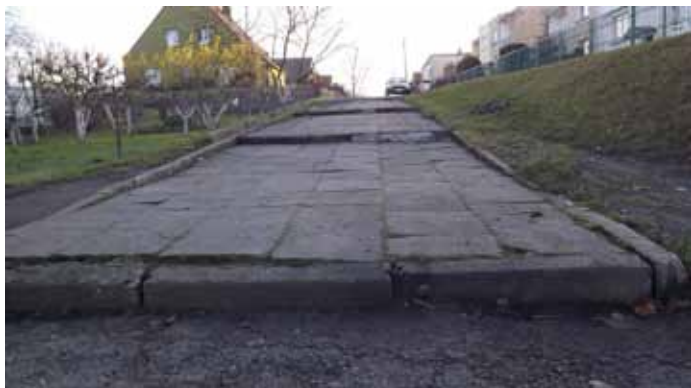
Nawierzchnia schodów na ul. Kilińskiego w Nowogardzie przed remontem

Dobiegają prace związane z remontem schodów przy ulicy Kilińskiego w Nowogardzie. Zakres prac obejmuje wymianę istniejącej nawierzchni schodów z płytek chodnikowych na kostkę betonową z fakturą granitową, wykonanie zjazdu dla rowerów i wózków, budowę murka oporowego z kostki ka-