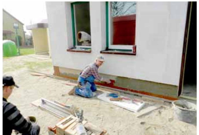
Świetlica po remoncie