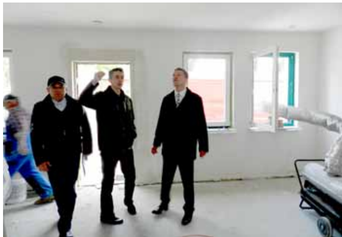
Świetlica po remoncie