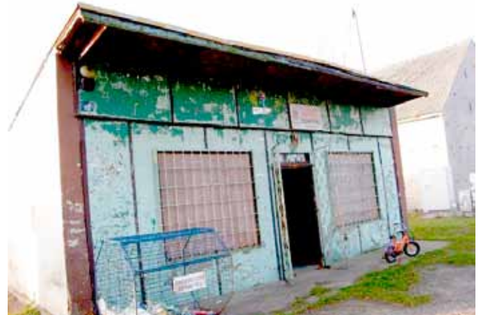
Świetlica przed remontem