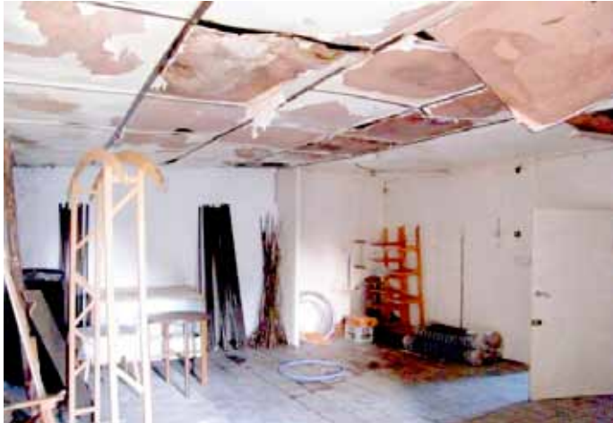
Świetlica przed remontem