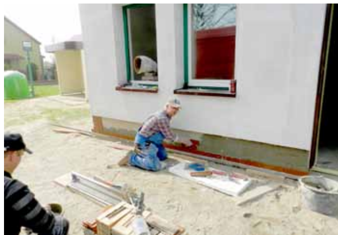
Świetlica po remoncie