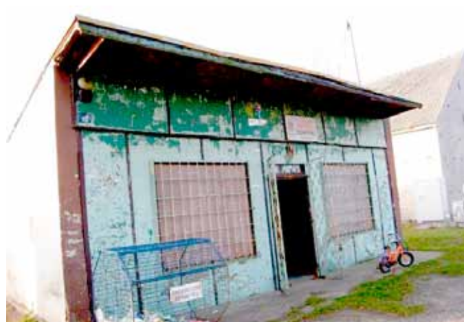
Świetlica przed remontem