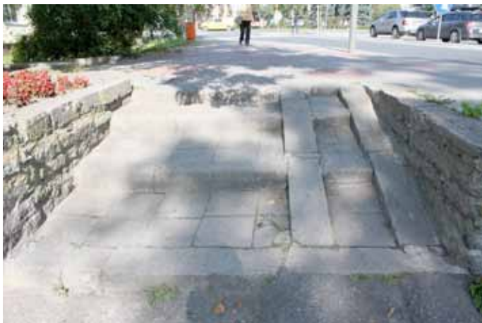
Przed remontem schodów

Zakończono remont ostatnich (czwartych) schodów prowadzących z ul. 3 Maja na ul. Zieloną. Na zdjęciach można zobaczyć jak wyglądały przed i jak wyglądają po remoncie.