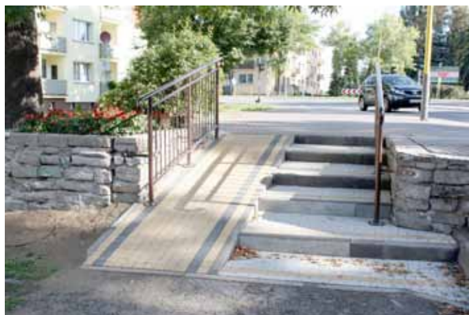
Po remoncie schodów