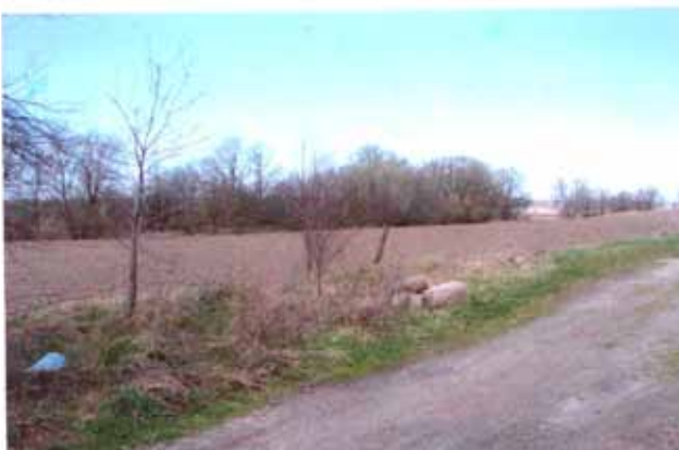
DOKUMENTACJA FOTOGRAFICZNA DZIAŁKA NR EWID. 85/2 OBRĘB SIKORKI GMINA NOWOGARD POWIAT GOLEŃSKI WOJEWÓDZTWO ZACHODNIOPOMORSKIE

Ogłoszenie o przetargu zamieszczono na stronie internetowej www.bip.nowogard.pl