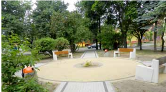
"... i po remoncie"