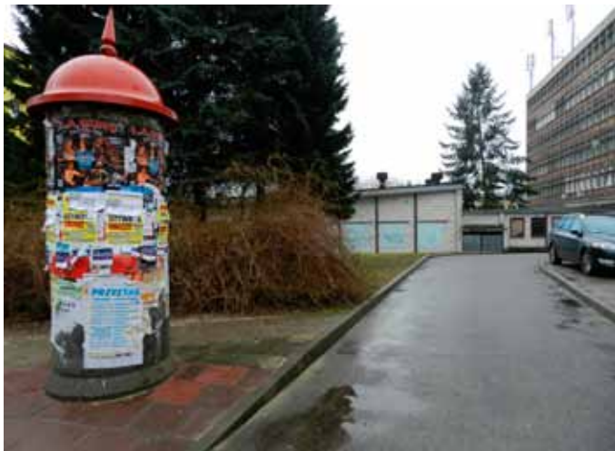
Uliczka przy tylnej ścianie ratusza. - tutaj powstanie 10 miejsc parkingowych