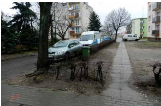
ul. 5 Marca – rejon sklepów „Groszek” i „U Ireny”. W miejscu widocznego żywoplotu – od jezdni (gdzie stoją widoczne pojazdy) do prowizorycznego chodnika powstanie 12 miejsc parkingowych (w tym dwa dla niepełnosprawnych).