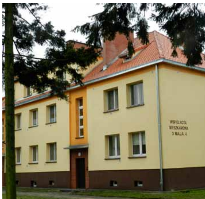
ul. 3 Maja 4