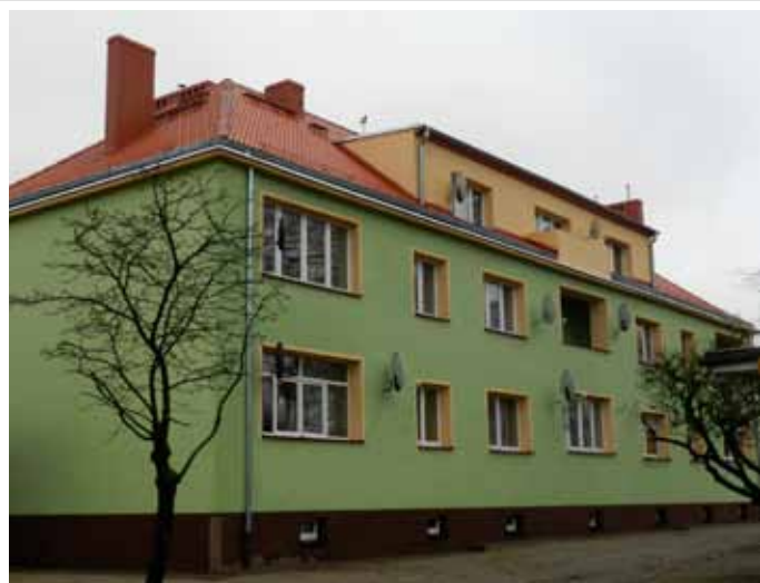
ul. 700 – lecia 8