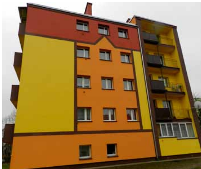
ul. 5 Marca nr 4