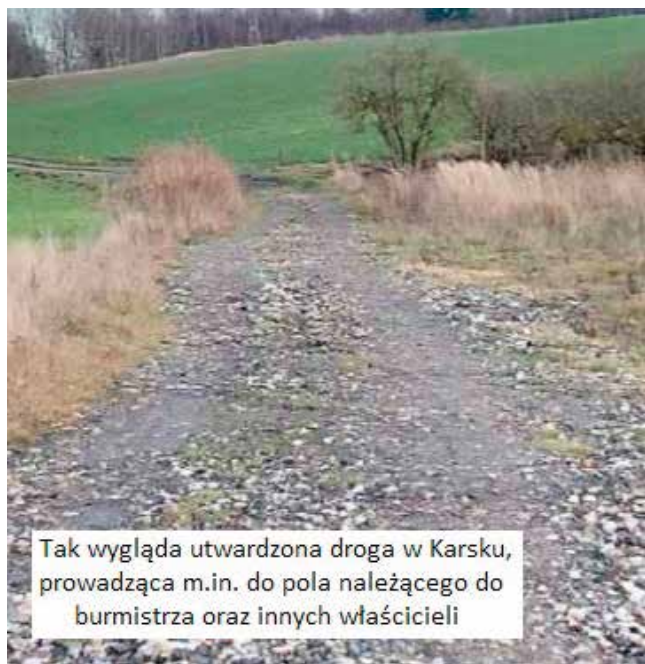
Tak wygląda utwardzona droga w Karsku, prowadząca m.in. do pola należącego do burmistrza oraz innych właścicieli