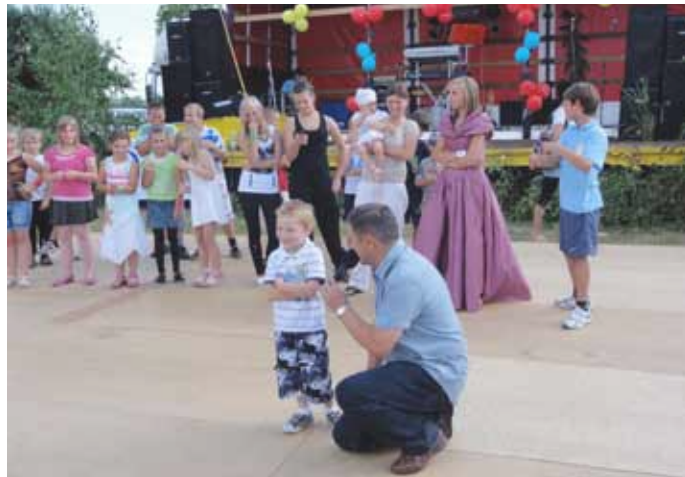
W Wojcieszynie wzorowo - radośnie i kolorowo